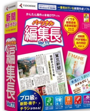
パーソナル編集長 Ver.11